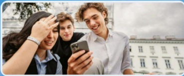
Digitalisierung & KI